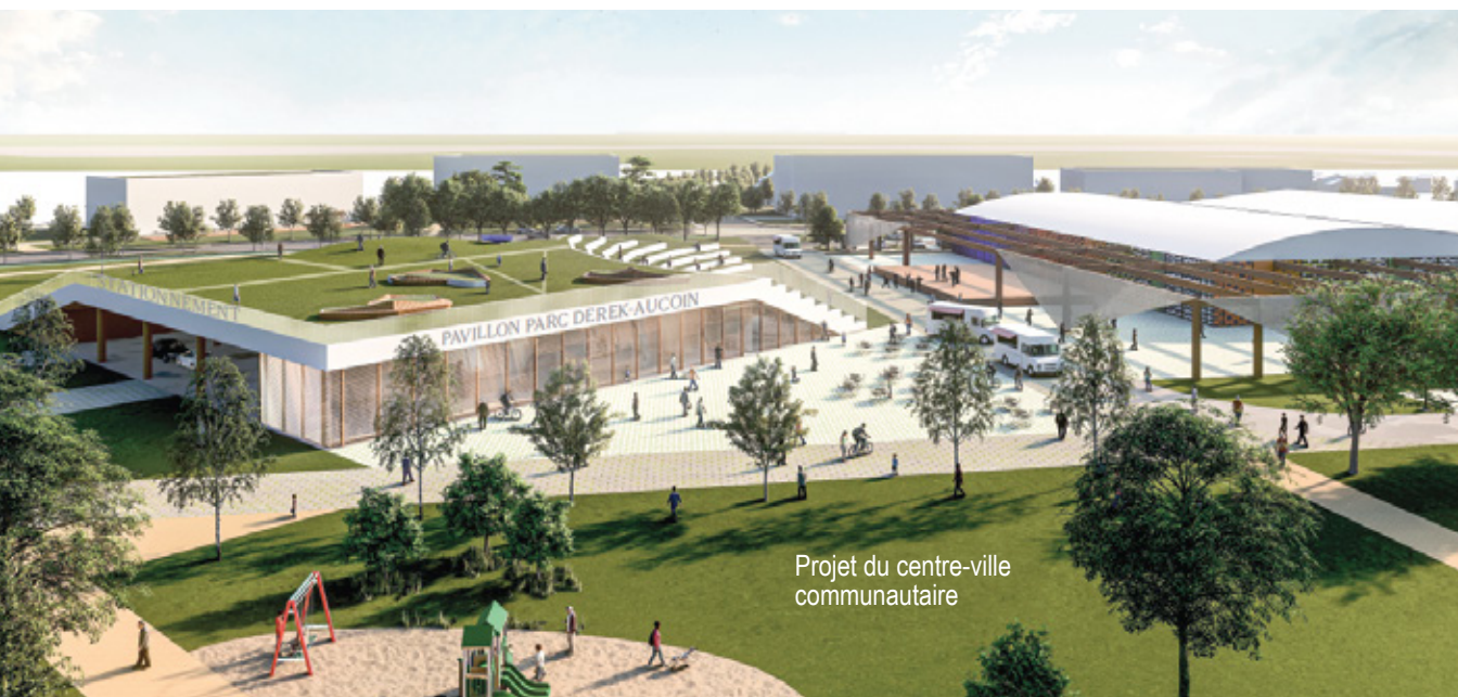
Projet du centre-ville communautaire