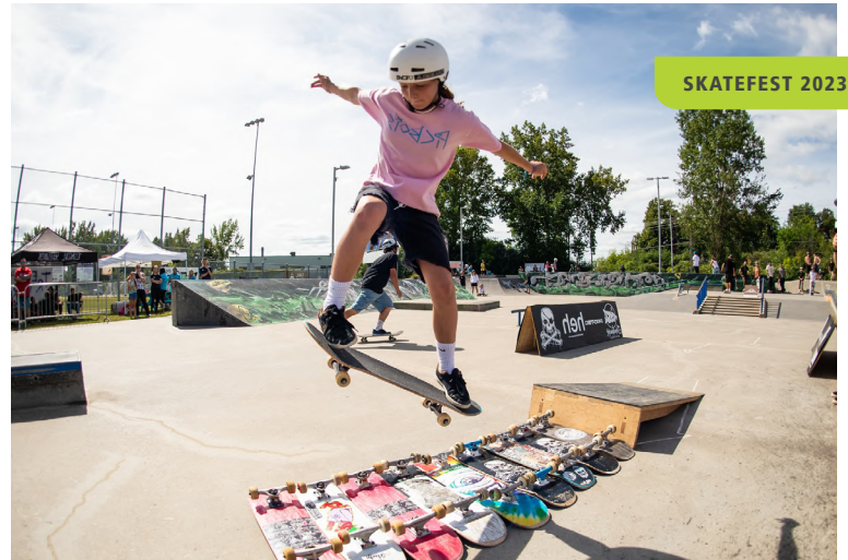
Planche à roulettes

Inscription obligatoire au 450 435-1954, dès le 15 avril à 9 h. Minimum d'un résident de Boisbriand par famille inscrite.